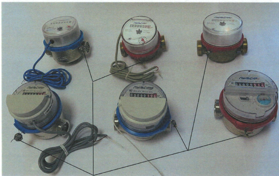
Место пломбирования и нанесения знака поверки

Знак поверки наносится на пломбу и на руководство по эксплуатации для исполнений счетчиков, приведенных на рисунке 2.